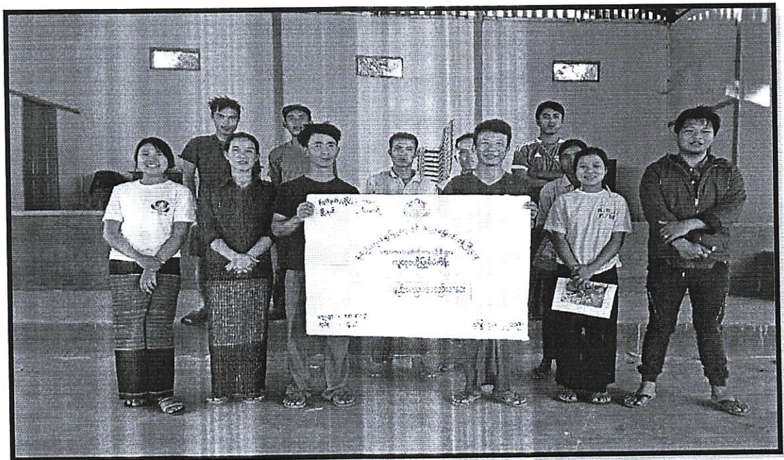
ကျေးရွာဖွံ့ဖြိုးရေးအစီအစဉ်၊ လူထုဗဟိုပြုစီမံကိန်း စာမျက်နှာ -၁၅-